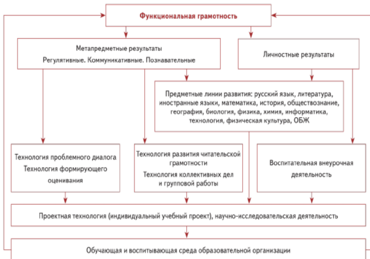
Схема: «Система работы школы по обеспечению личностных и метапредметных (УУД) результатов школьников»

Из схемы видно, что существует несколько механизмов развития личностных и метапредметных результатов: